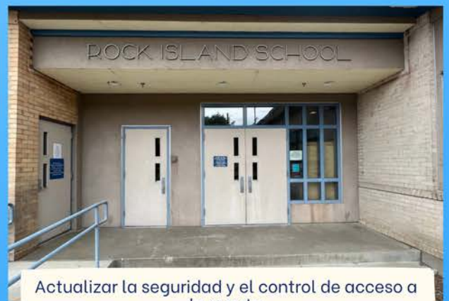
Actualizar la seguridad y el control de acceso a la puerta

Creemos que este momento tiene sentido porque los costos de construcción aumentan cuanto más esperamos, la seguridad física de nuestros estudiantes y personal no puede esperar, nos aseguramos de tener la capacidad para más estudiantes a medida que llegan nuevos negocios al Valle, y el estado danos $14 millones adicionales en contrapartida de construcción para hacer este trabajo.