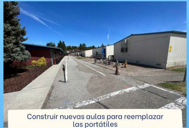
Construir nuevas aulas para reemplazar las portátiles

La Fase 2 es la fase final de nuestro actual plan de mejora de las instalaciones. La Junta Directiva del Distrito Escolar de Eastmont aprobó una resolución para presentar a los votantes del distrito una propuesta de bonos de $185 millones en la boleta de las elecciones generales del 8 de noviembre de 2022.